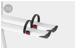
O3 Rail Plus Nuevo diseño para una mayor resistencia a la torsión y a la flexión