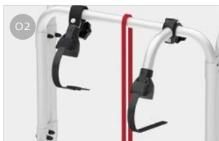
O2 Bike-Block Sistema de sujeción de la bicicleta