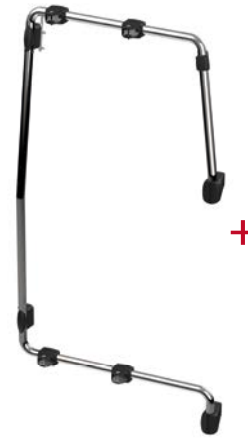
Kit Frame Crafter