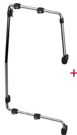
Kit Frame Crafter

04 Structure porte-rails en Inox Pour 3 vélos standard ou 2 vélos électriques